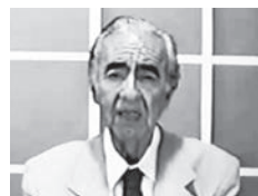
Palavras-chave: O pior programa de TV da história

Os fãs do profeta Nostradamus vão ficar apavorados com este programa que foi ao ar em 2006 pelo Canal Comunitário do Rio de Janeiro. Durante quase dez minutos um senhor de sobranceiras esquisitas (seria o próprio profeta?) balança a cabeça enquanto um narrador relaciona a passagem de um cometa com a morte do papa João Paulo II, entre outros acontecimentos. Ai que medo!